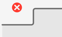
Schwellen ab 20 cm