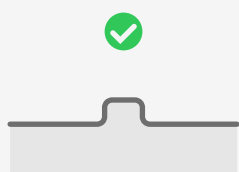
Freistehende Schwellen bis 5 cm 1