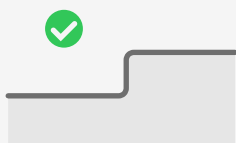
Schwellen bis 20 cm